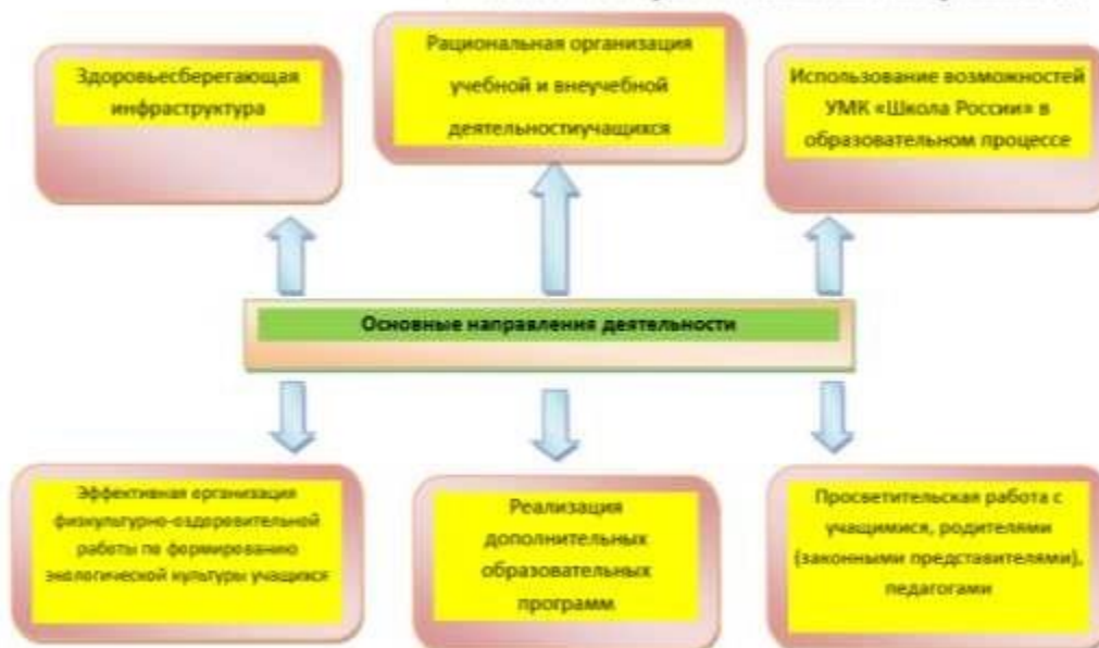
Рис. Основные направления деятельности в рамках ЗОЖ

Работа по формированию экологической культуры, здорового и безопасного образа жизни на уровне начального общего образования ведется по направлениям: